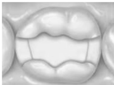
Baratieri, Odontologia Restauradora Fundamentos e Técnicas

30. Na dentística, pode-se classificar as cavidades de acordo com as faces envolvidas. A imagem abaixo é de um primeiro molar inferior, onde as cavidades envolvidas no preparo são a mesial, a oclusal e a distal. A alternativa que corresponde à classificação da cavidade representada na imagem é: