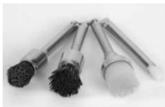
Baratieri, Odontologia Restauradora Fundamentos e Técnicas

31. Os instrumentais utilizados na Odontologia, em procedimentos de limpeza da superfície dental, e que estão representados na imagem a seguir, são: